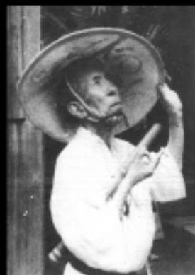
Tsuji Jun (辻 潤, Tsuji Jun, October 4, 1884 – November 24, 1944)

Diorbitkan di Indonesia oleh Contemplative Publishing , cetakan pertama, Februari 2025. Didistribusikan oleh Jaringan Penerbit Anarkis, Ngazarah Press, dan Jerih Payah Media.