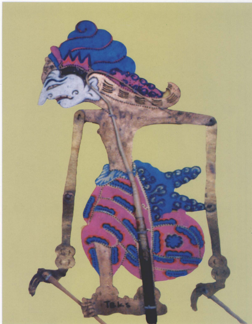
7. BATARA ASMARA

Batara Asmara is the youngest child of Sanghyang Manikmaya and Dewi Umarekti. His task is to reunite divorced pairs and turn them into pairs that are full of love and live happily.