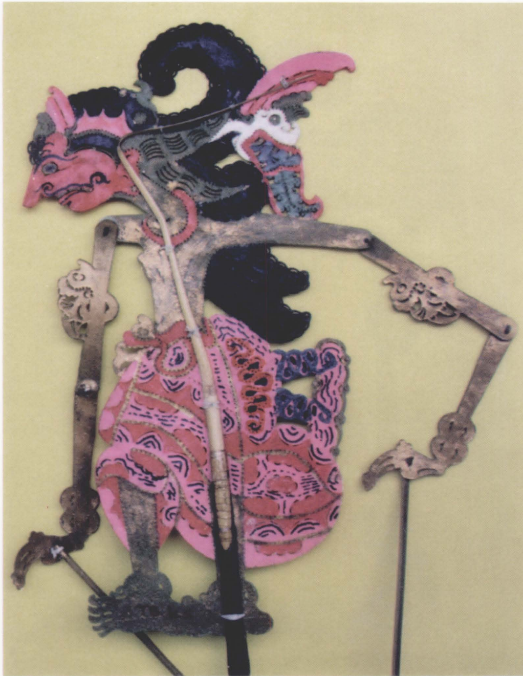
69. PATIH RANGSIAN DEWA