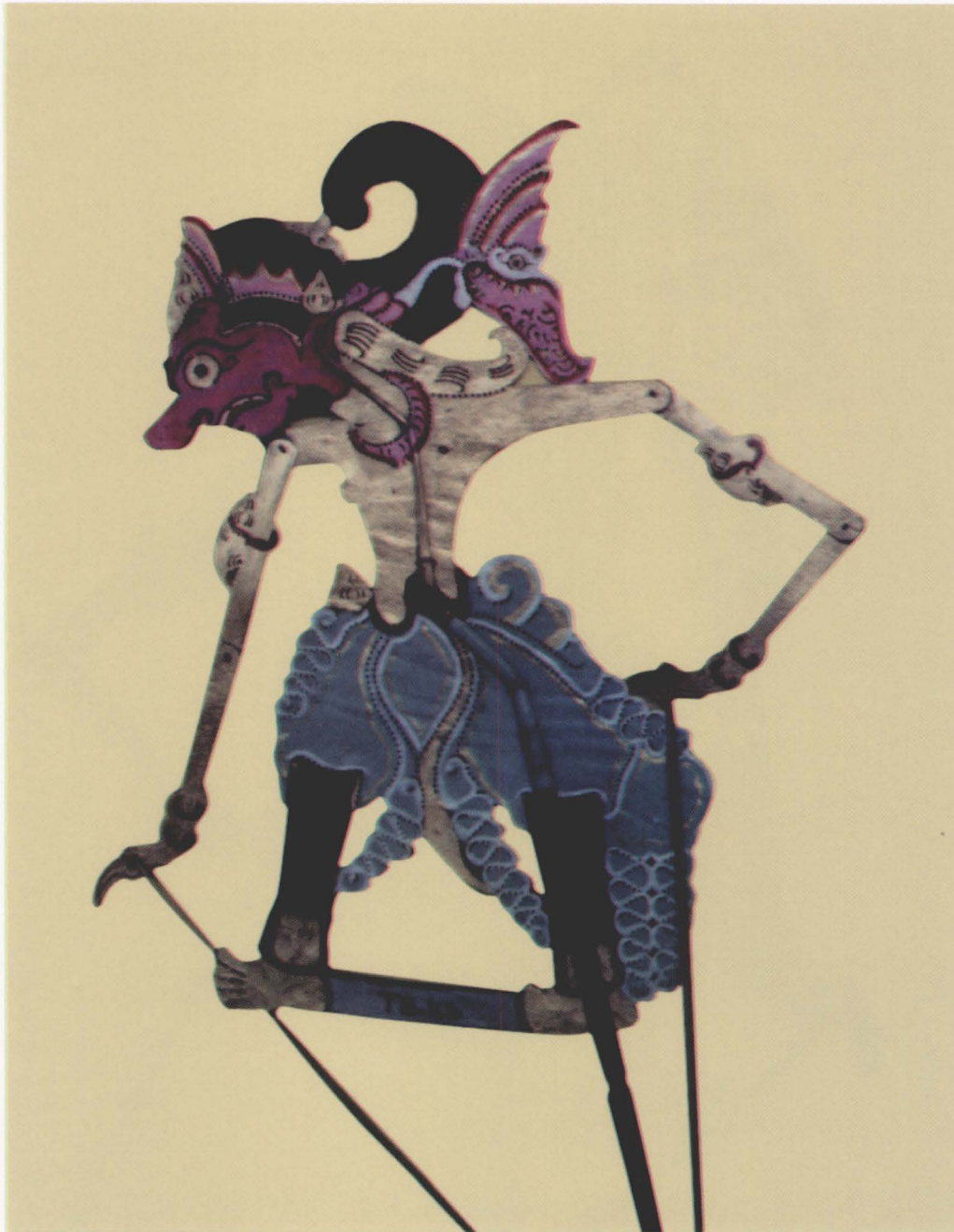
67. INDRAJIT / MEGANANDA