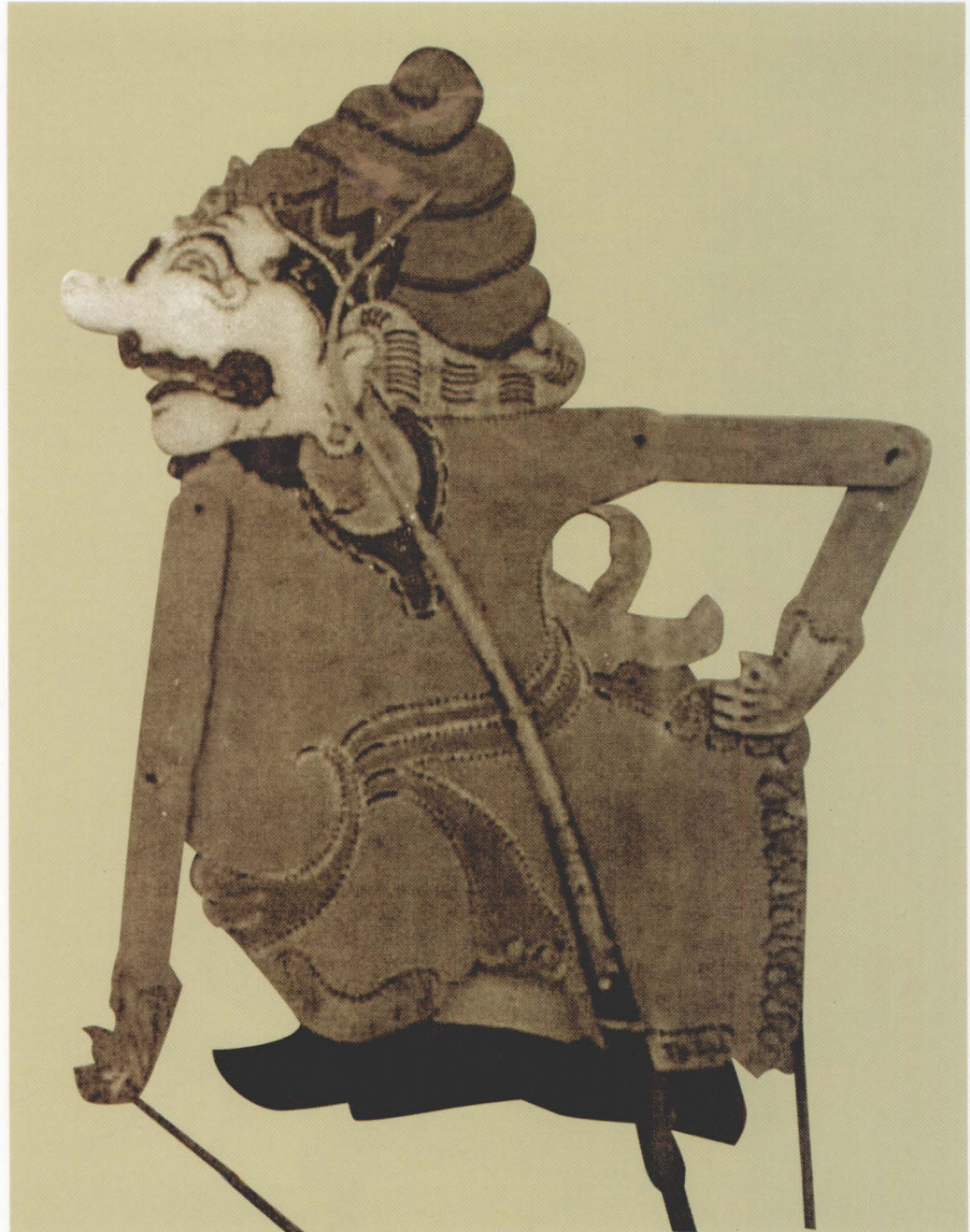
3. BATARA NARADA

Batara Narada is a patih (Prime Minister) of Kayangan Suralaya. He is very devout and has a great knowledge; he is also cheerful and honest. Those are the qualities that make his words complied by any god or human being.