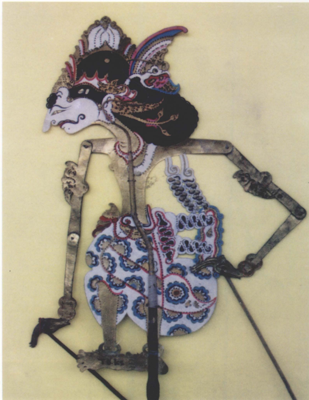
66 PRABU KUSUMAH DALWIH

Prabu Kusuma Dalwih has jaitan eyes, sharp and well-formed nose, and a serene expression. He wears three-tiered jamang that is decorated with a garuda facing backwards, kluwih flower sunting, and bokongan kraton cloth.