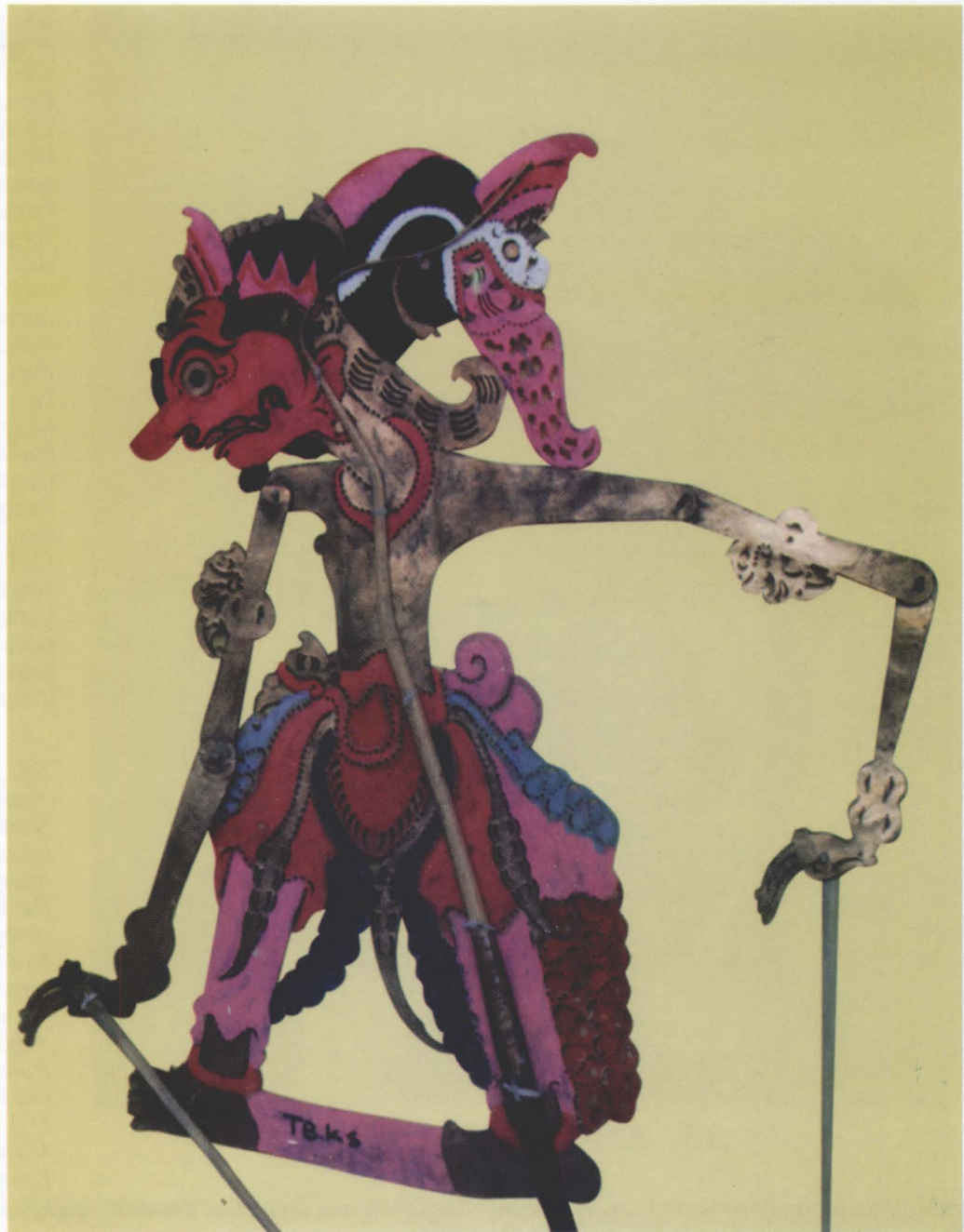
54. JAKA TAWANG / ANTASENA

Jaka Tawang is the youngest son of Wrekudara. His mother is Dewi Urang Ayu from a kingdom on the ocean floor. Since he was born, Jaka Tawang lives with his grandfather and his mother at Kisik Narmada (an estuary where the Gangga river meets the Sedayu river). He is honest and frank, modest, and he never lies. He has scales all over his body, and no weapon can harm him. He has lethal feeler that can kill, but it can also enliven people who die before their time. Jaka Tawang will never die as long as his body touches the earth or comes into contact with vapor. He reached redemption (moksa) before the Baratayudha war began.