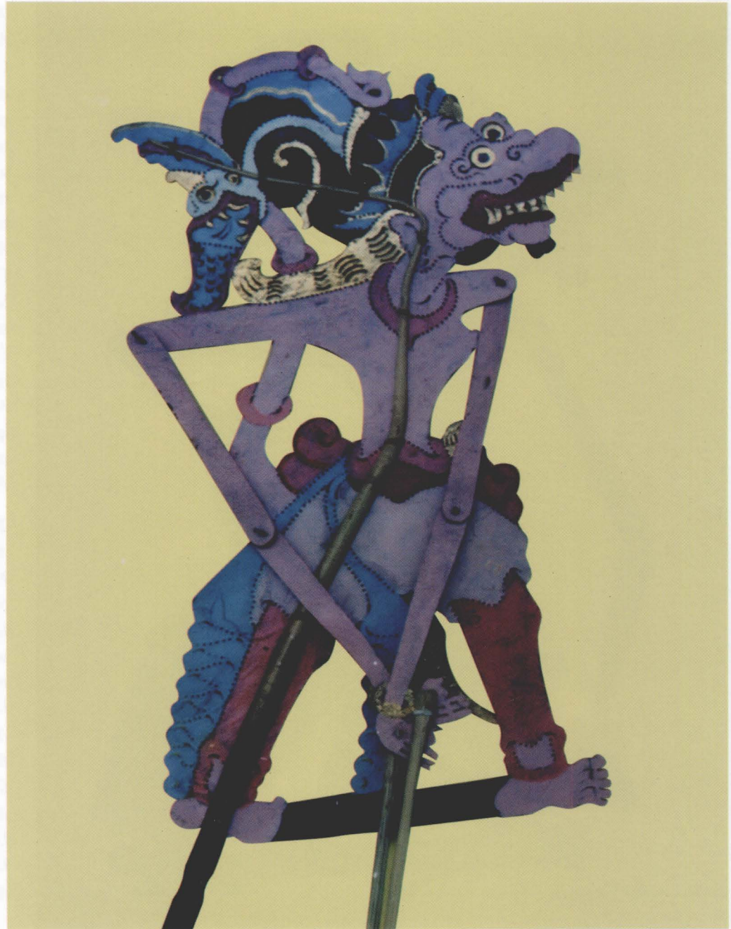
27. R. ANALA / ANILA

Anila is one of the troop leaders of Prabu Sugriwa of Kiskenda kingdom. Anila, whose fur is reddish-orange in color, was created from Hyang Brahma's mythical son to strengthen the monkey troops that will help Prabu Rama bring Sinta back. Anala can walk under the earth and is an expert in architecture. He was the architect who supervised the making of a bridge in the Rama Tambak episode.