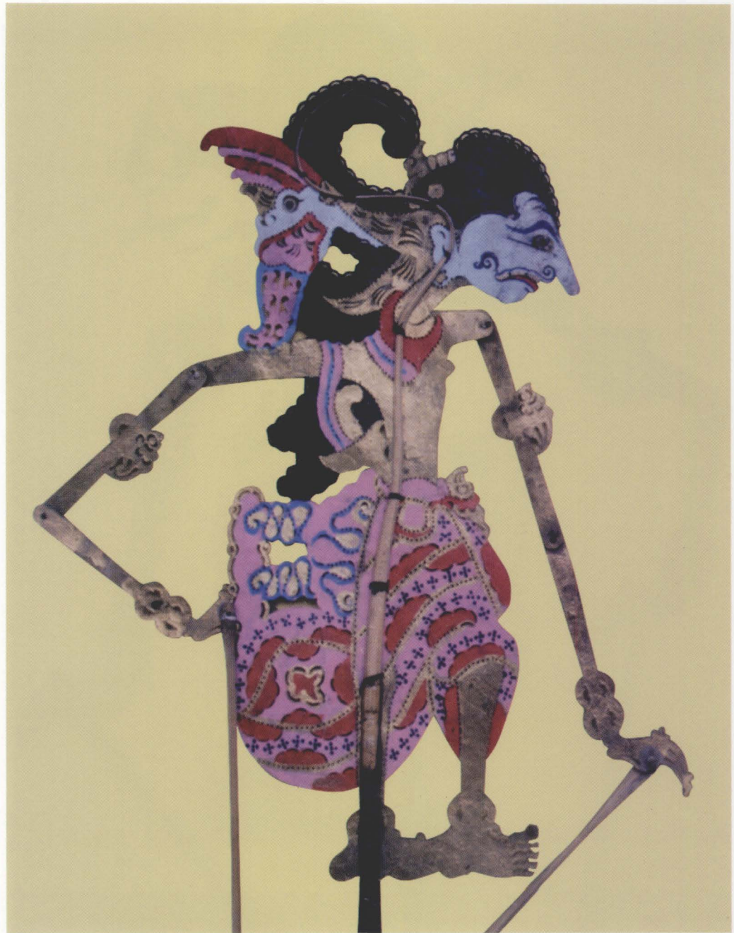
72. ARYA GIBANG

Arya Gibang is a handsome king from overseas. He is not a standard figure, so his name and kingdom vary according to the scene and the puppet master's creativity. In Banjar, Arya Gibang is said to be coming from Tatak Salaka Rotan Sagalung to challenge the Amarta/Pandawa ruler. He has a sharp and well-shaped nose and a serene expression. His hair is fastened to a bun (sanggul); and he wears a crescent-shaped necklace, bracelets, pontoh, and bokongan cloth.