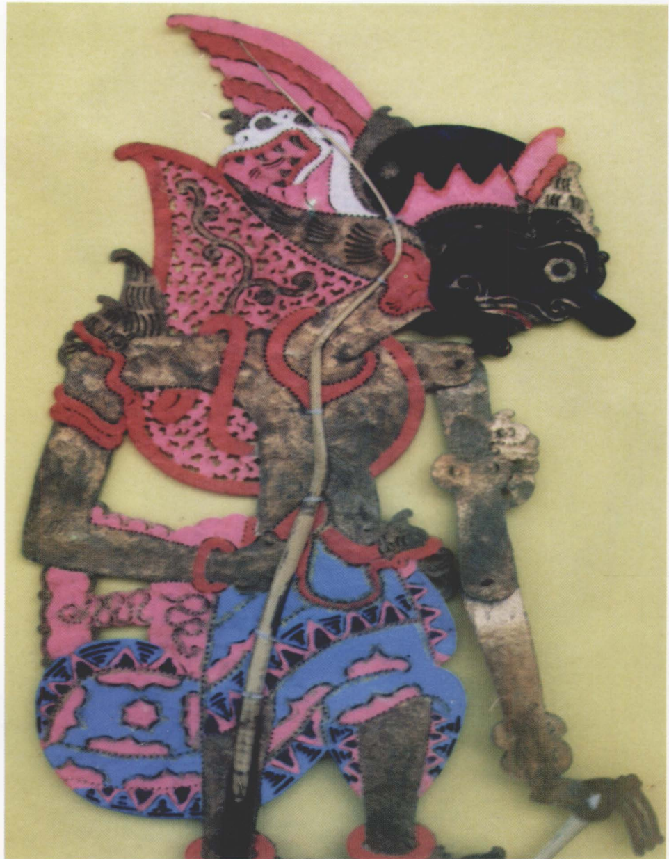
56. PRABU DURYUDANA

Prabu Duryudana has telengan eyes and a dampak nose. He wears three-tiered jamang decorated with a garuda bird facing backwards, praba, necklace, bracelet, pontoh, and royal bokongan cloth.