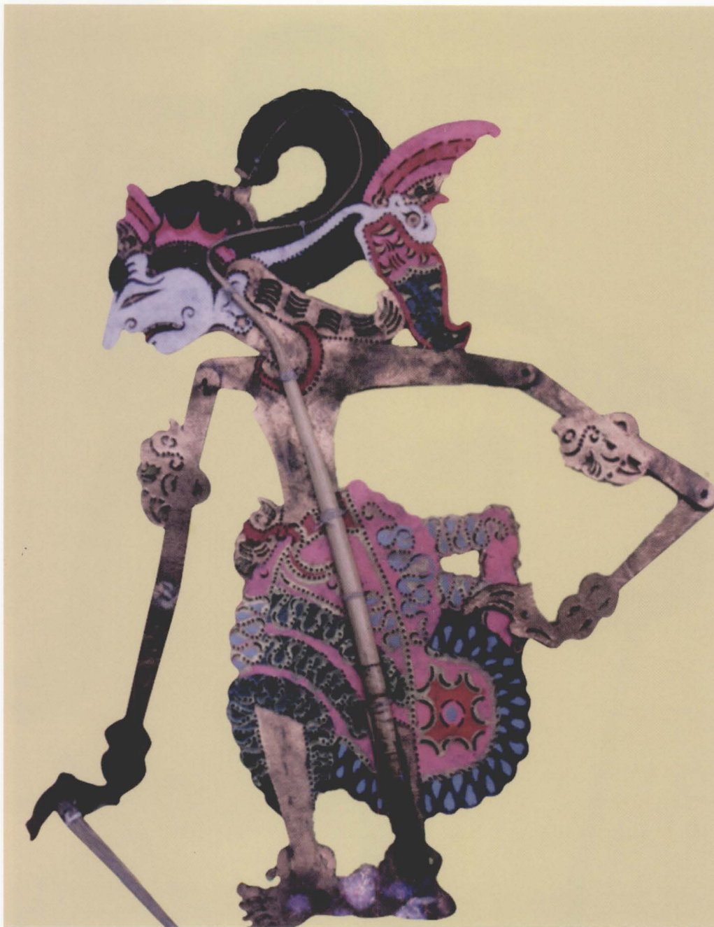
71 LENGLENG BUWANA /JAYAMURCITA