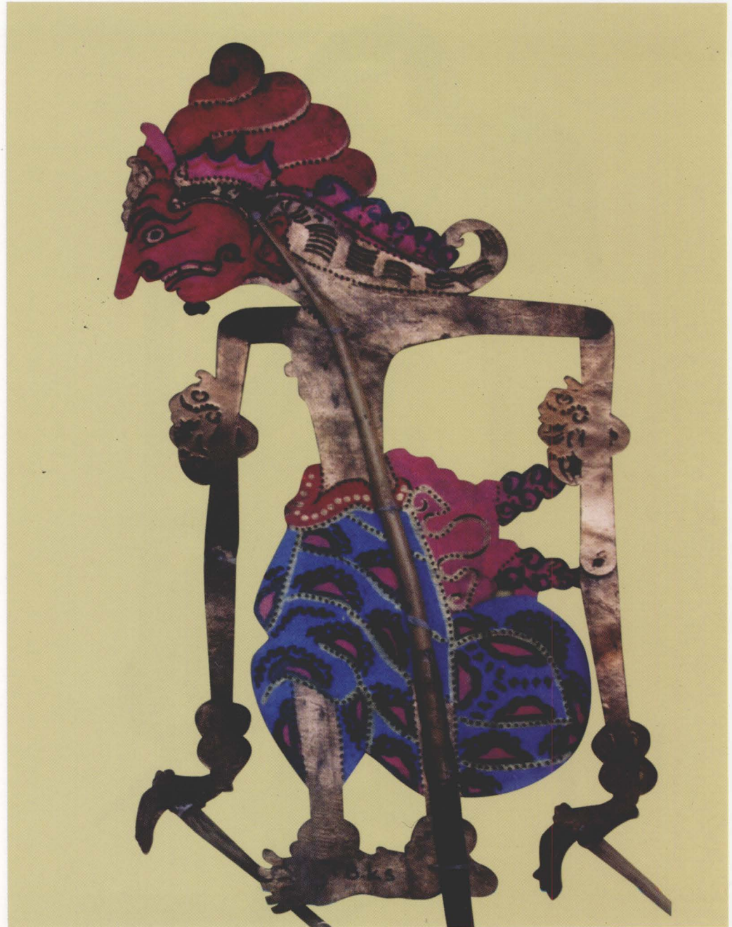
5. BATARA INDRA

Batara Indra is a caring and kind god, and he loves art and aesthetics.