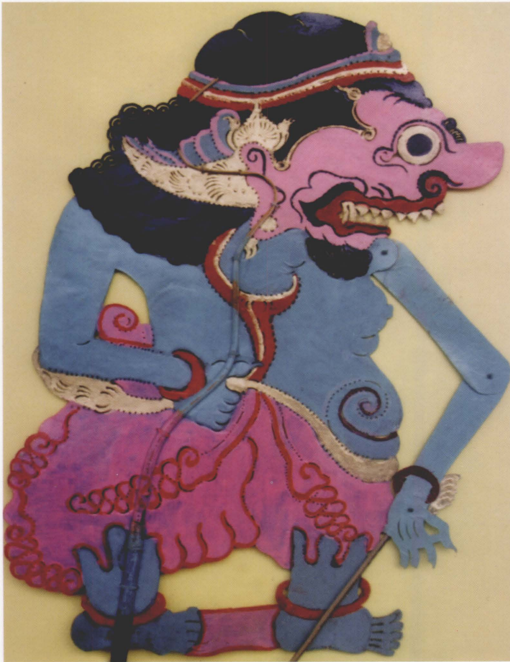
36. KEDAKIT BIRU