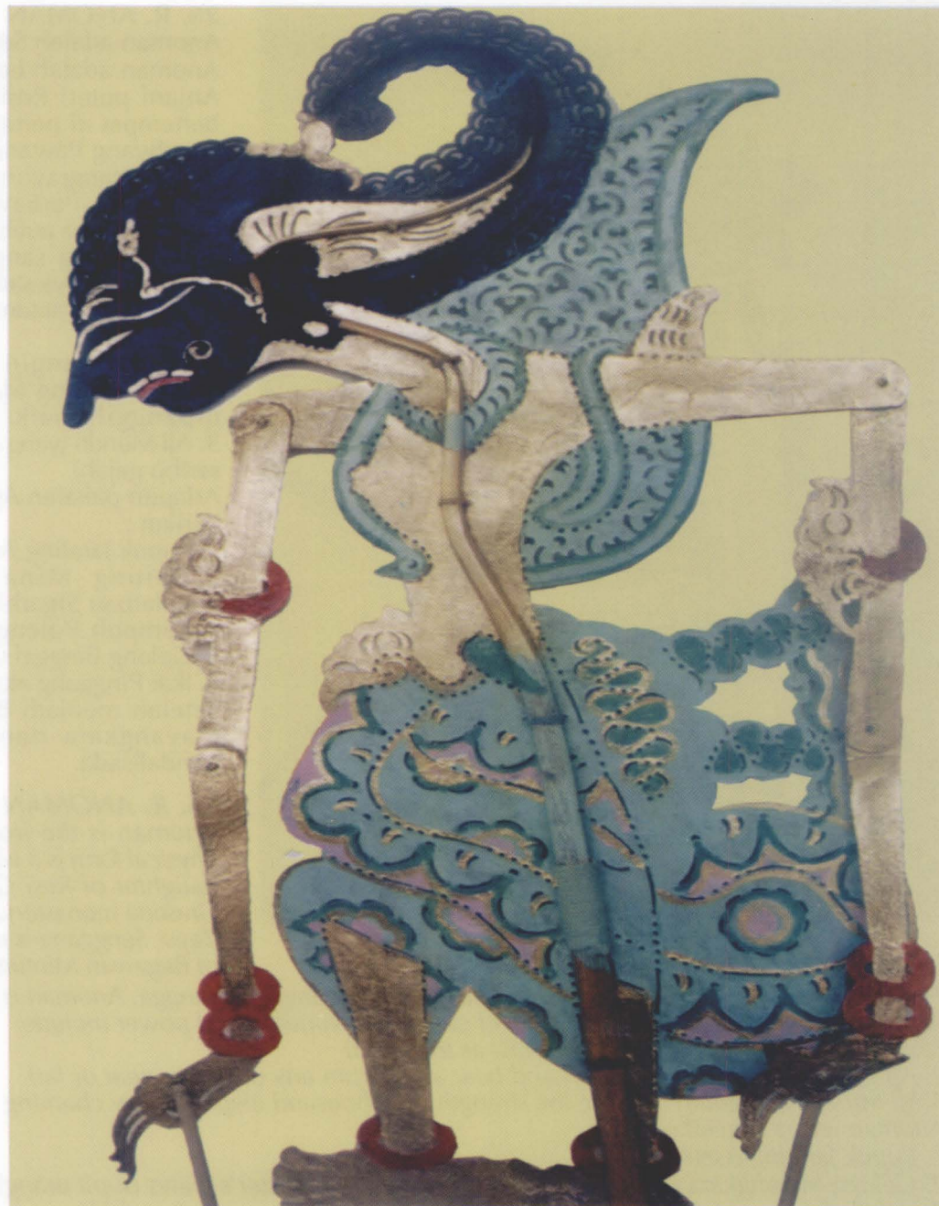
25. R. WIBISANA

In the great war of Alengka, Wibisana was the key to Sri Rama's victory. Therefore, after the death of Rahwana, Sri Rama appointed him the new king of Alengka to succeed Rahwana.