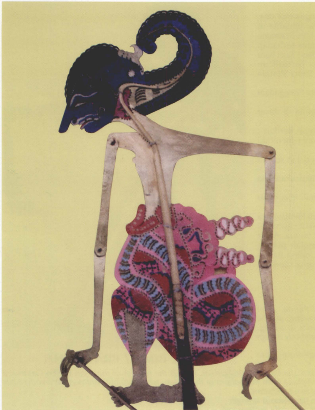
46. R. ARJUNA / JANAKA