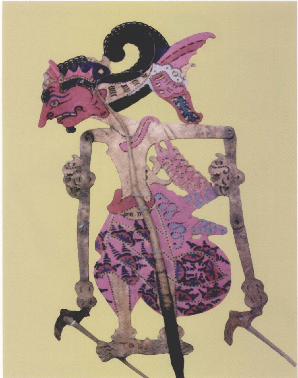
68. BAMBANG RASIAN DEWA IKATAN

Bambang Rasian Dewa Ikatan rules in the Tersila Amparan kingdom. As a symbol that he is a king comes from overseas, he wears jamang that is decorated with a garuda bird facing backwards, pontoh, and bracelet.