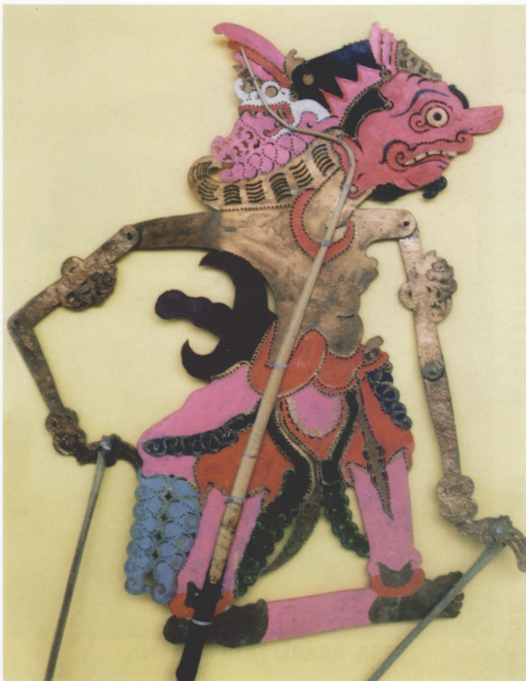
57. RADEN DURSASANA