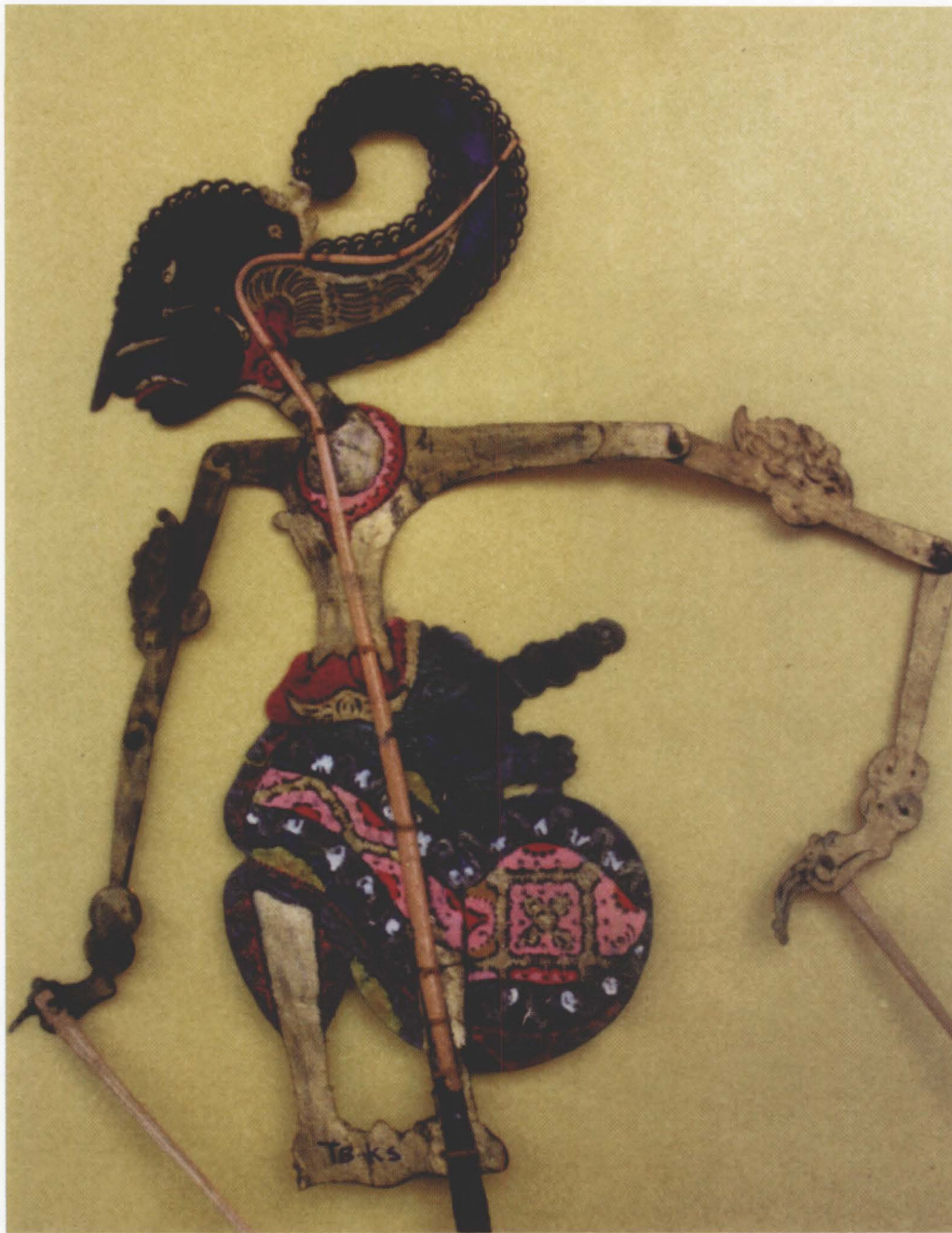
42 PANDU DEWANATA