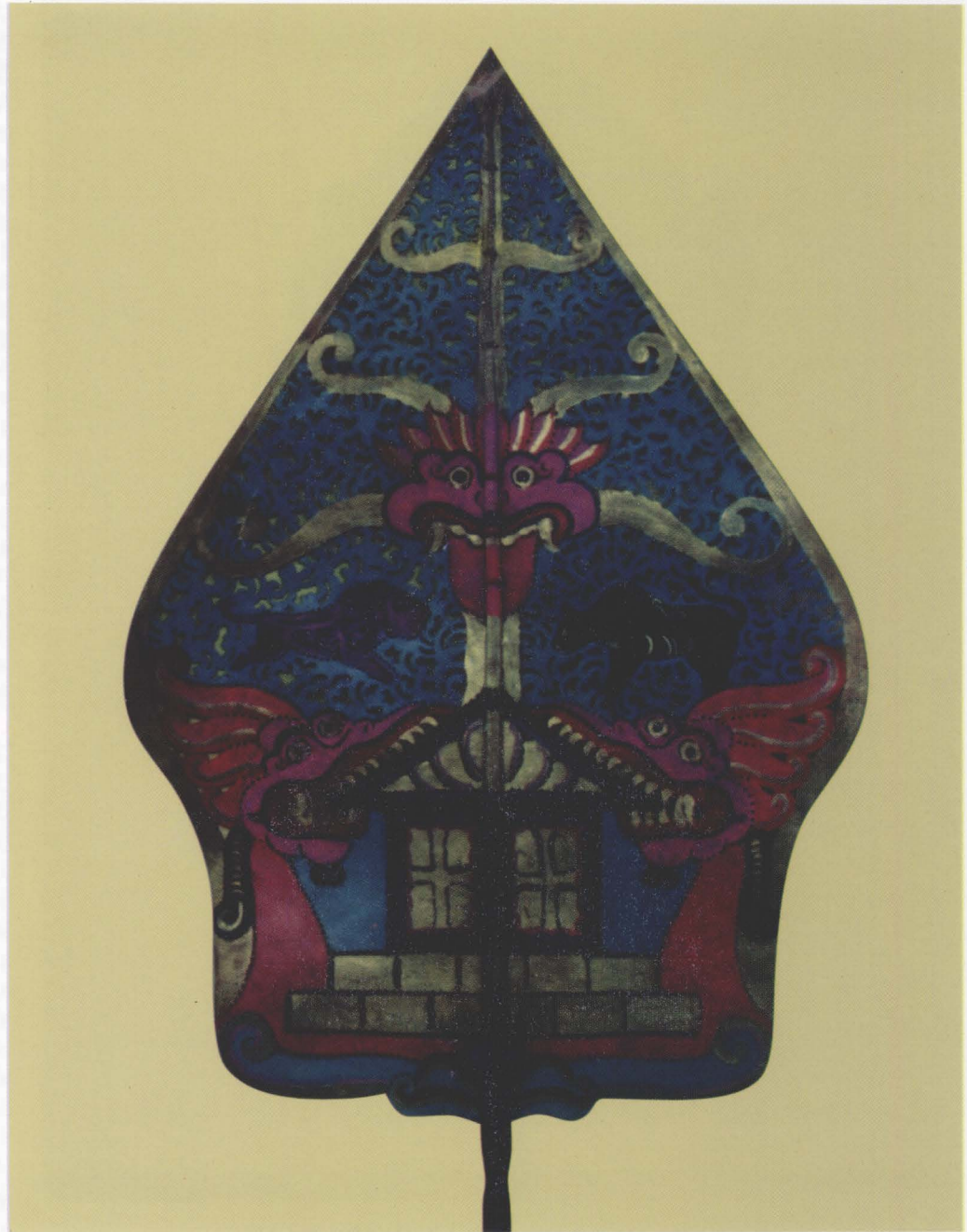
1. GUNUNGAN / KAYON

Gunungan is a symbol of universe, in which there are symbols of animal, plant, and human being or homo sapiens. In a pakeliran, which is a wayang stage with its screen (kelir = screen), gunung represents fire, ocean, and the gate of a palace. It is used in every scene. Before a performance, gunung will appear. Gunung is also used in between scenes, and it marks the end of a performance.