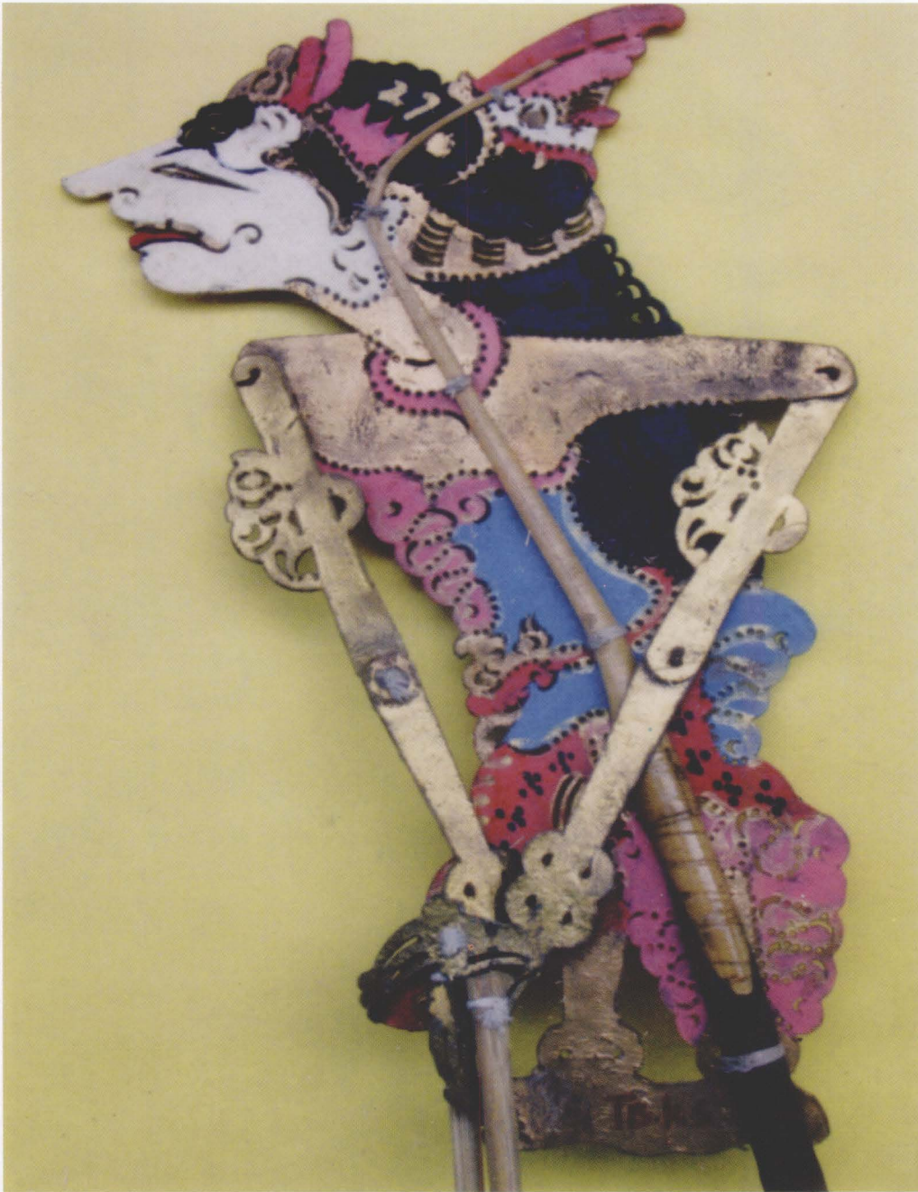
51. SASI UDYA MUSTIKA