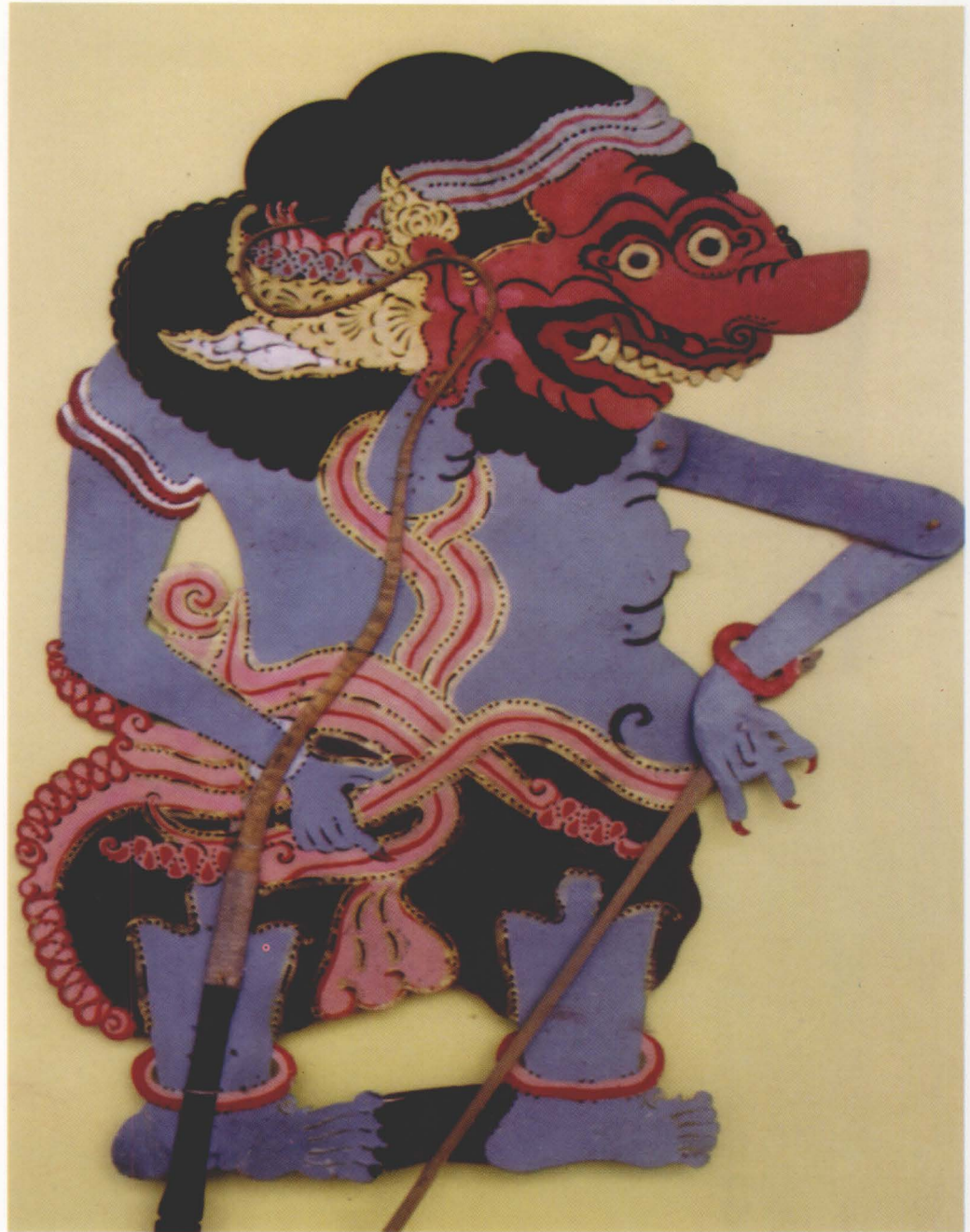
37. KEDAKIT KLAU

This giant belongs to the category of Raksasa Prepat, which can be performed to the liking of the puppet master. Kedakit Klawu has plelengan eyes and shown teeth and incisors. His jamang (headdress) is shaped like a kopyah or peci (rimless cap). He wears a birawa ulur-ulur necklace, bracelet, and pontoh; and he can only move his front hand.