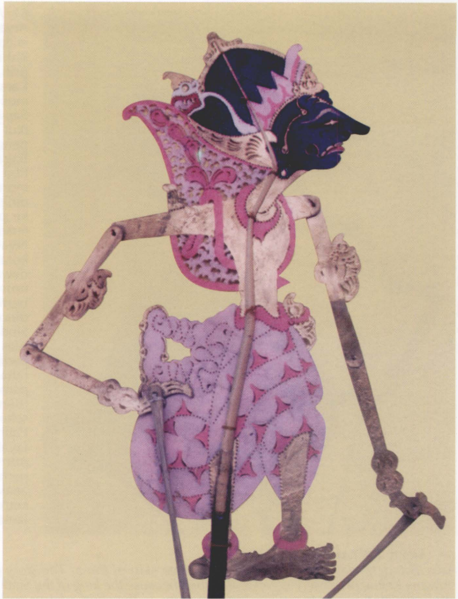
60 ADIPATI KARNA

Adipati Karna has jaitan eyes and well-shaped nose; and his face is pointed upwards. He wears a ketopong-shaped crown, a three-tiered jamang that was decorated with a garuda facing backwards, a kluwih flower sunting, praba, bracelet, pontoh, and bokongan kraton cloth.