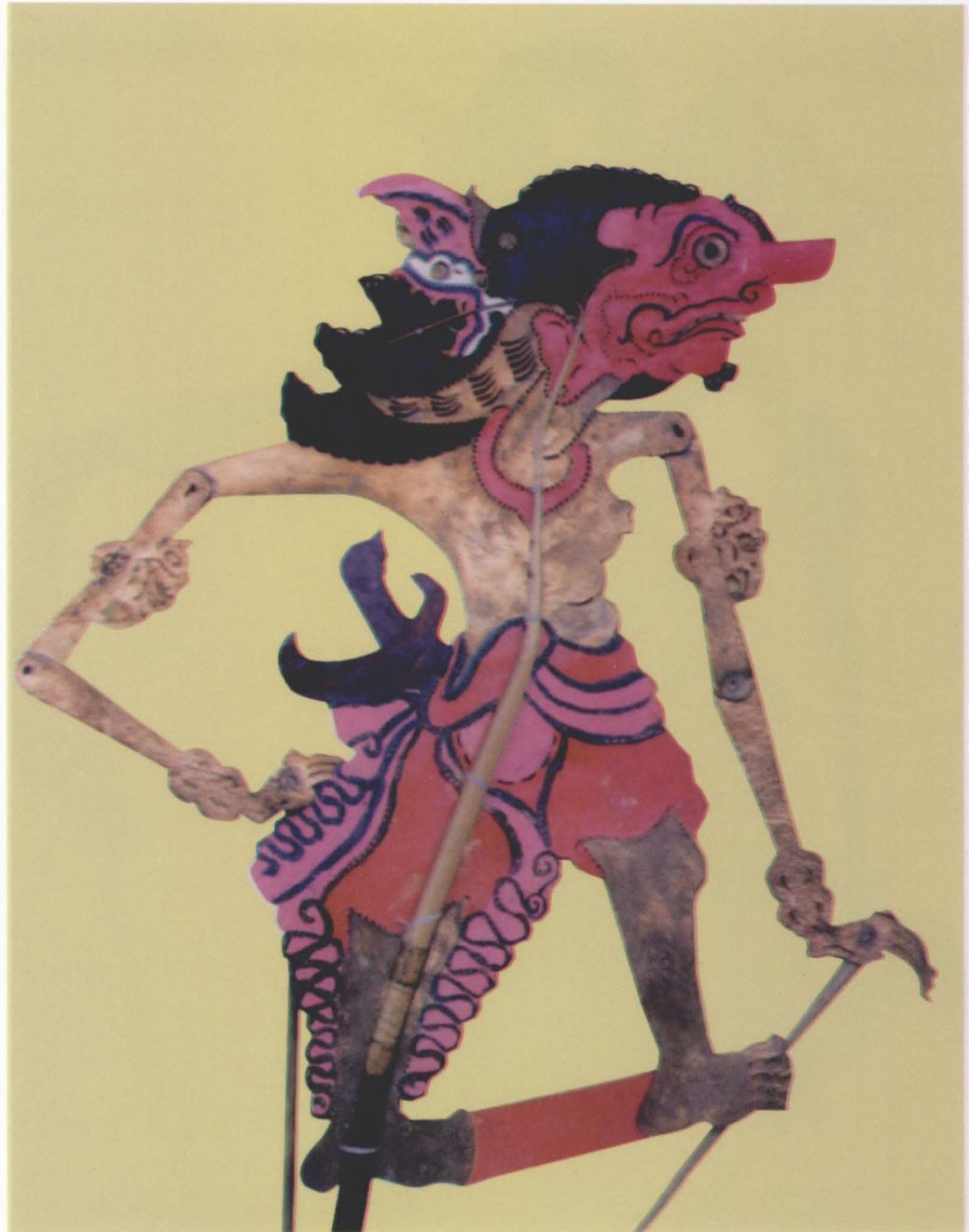
64. R. BURISRAWA

According to the Mahabarata script, Burisrawa is the son of Prabu Bahlika. In Banjar and Java, however, his father is Prabu Salya. Burisrawa, who is strong a robust, is an arrogant person always does whatever he likes regardless of other people's feeling. He is also revengeful and egotistic. In the great Baratayudha war Burisrawa, who fought in Kurawa's side, was killed in a duel with Setyaki.