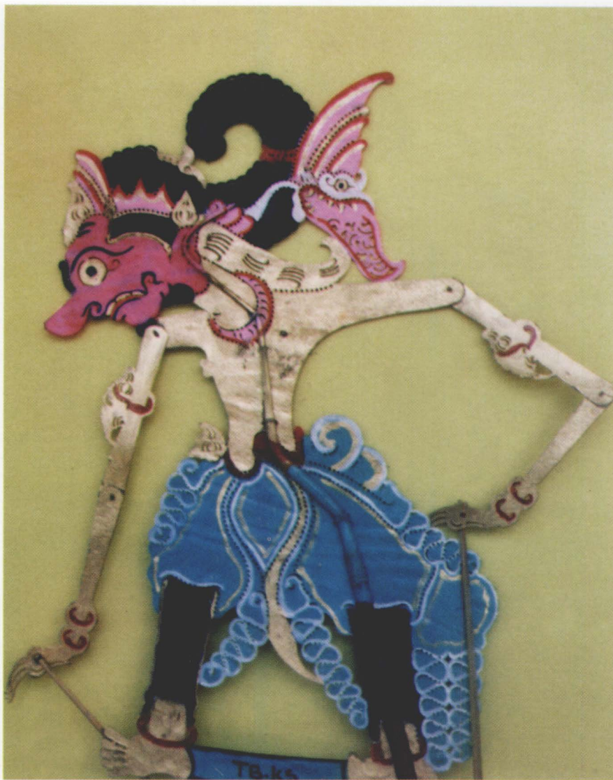
52. RADEN ANTAREJA

The story about his death is found in the "Pandawa Tawur" episode. It took place just before the war. Baratayuda is the great war of the Kuru clan who fought over the Astina kingdom. To win it, a high level sacrificial ceremony, Tawur, must be performed by sacrifices a family member. Antareja offered himself to be sacrificed for the sake of Pandawa's victory. Because no weapon can harm him, Antareja killed himself by licking his own foot print. Due to its unselfish act, the Baratayuda was indeed won by the Pandawas. To honor Antareja, his son was appointed a Patih (Prime Minister) of the Astina kingdom under the reign of Prabu Parikesit.