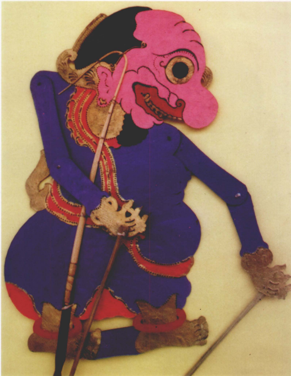
38. SILUMAN KATONG