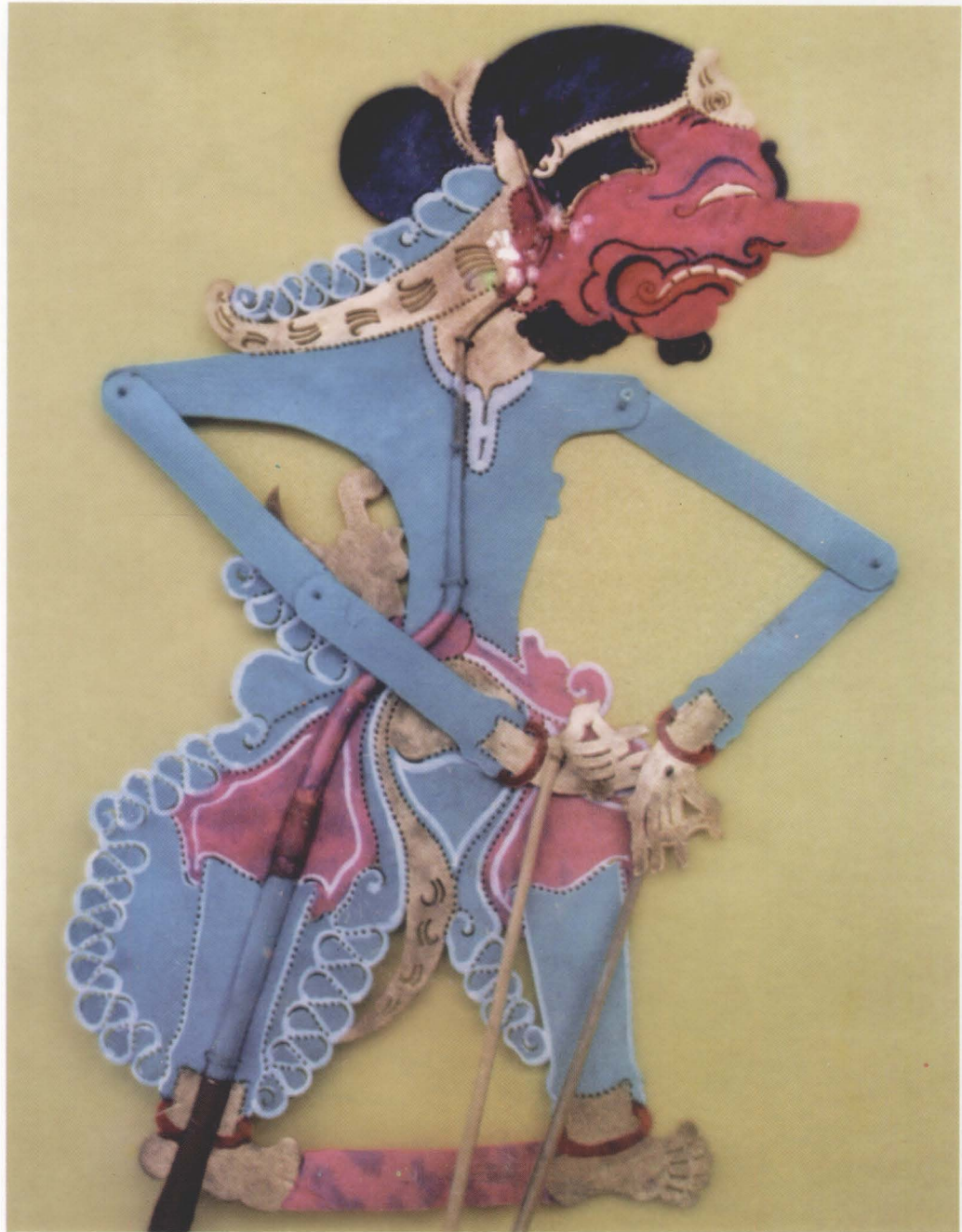
58. PATIH ARYA SAKUNI

Sakuni is the Maha Patih (Prime Minister) of the Astina kingdom during Drestarastra's reign. Sakuni is good in both state management and military strategies. According to the Mahabharata script, Sakuni is the king of Gandaradesa, who was titled Prabu Gandara. He is married to Dewi Sukesti, who bore him Surasekti. In the Baratayudha war, Sakuni's mouth was killed by Wrekudara, who ripped his mouth. He is bearded, and has kedondongan eyes and gusen teeth. His hands are different in form: one is a giant's hand, while the other is pointed like a joker's hand. Sakuni wears bracelet and a turban (Javanese = udheng-udhengan).