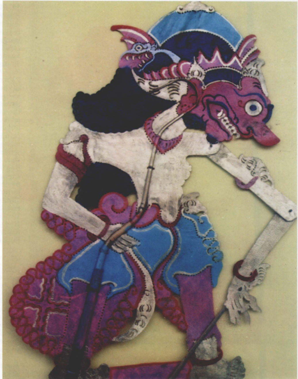
21. PATIH LEMBU SURA

Lembusura was the patih (Prime Minister) of Gua Kiskenda, which was ruled by Prabu Maesasura. He was killed by Sugriwa during an incident, that is when Maesasura wanted Dewi Tara to be his wife. The gods refused to submit the goddess and sent Sugriwa and Subali to destroy them. Patih Lembusura was killed by Sugriwa, while Prabu Maesasura and Jatasura by Subali. As a reward, the kingdom of Gua Kiskenda was given to Sugriwa-Subali and they were allowed to marry Dewi Tara.