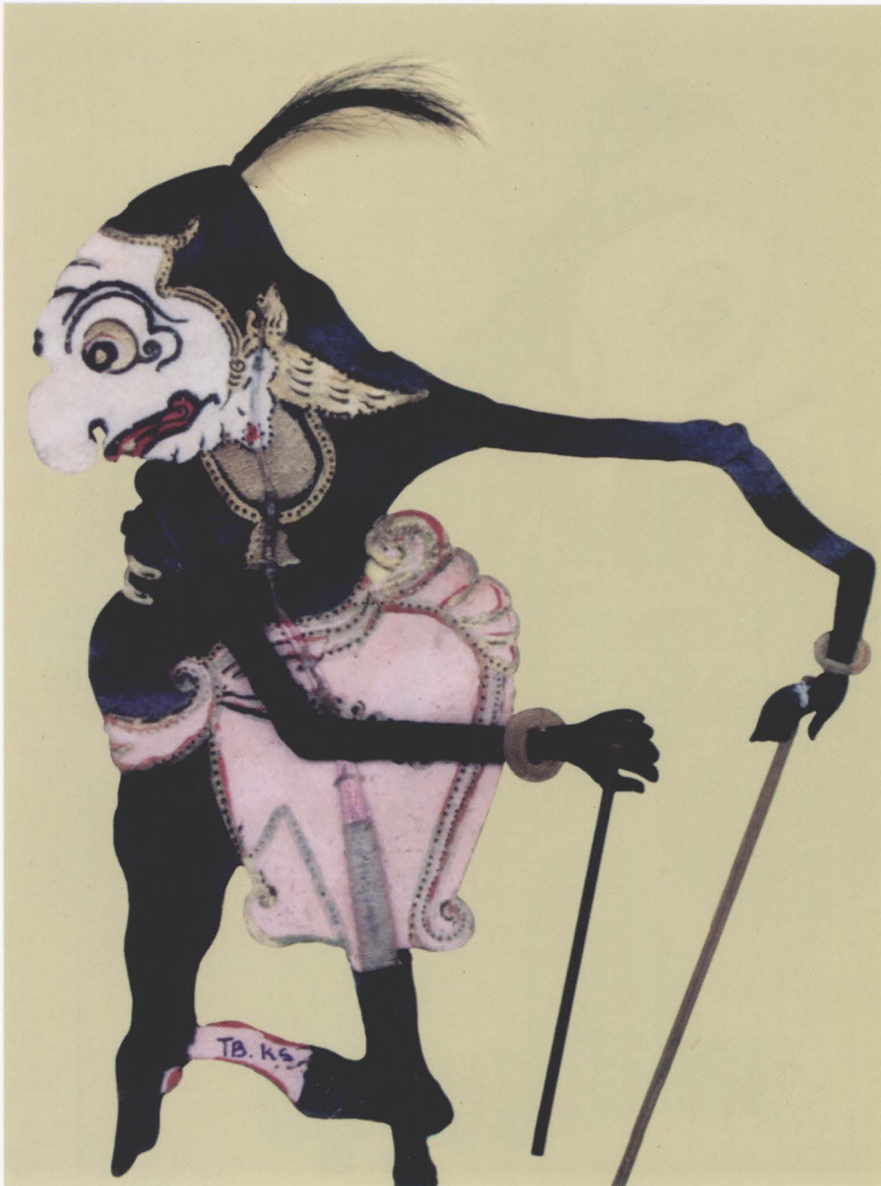
12. NALA GARENG