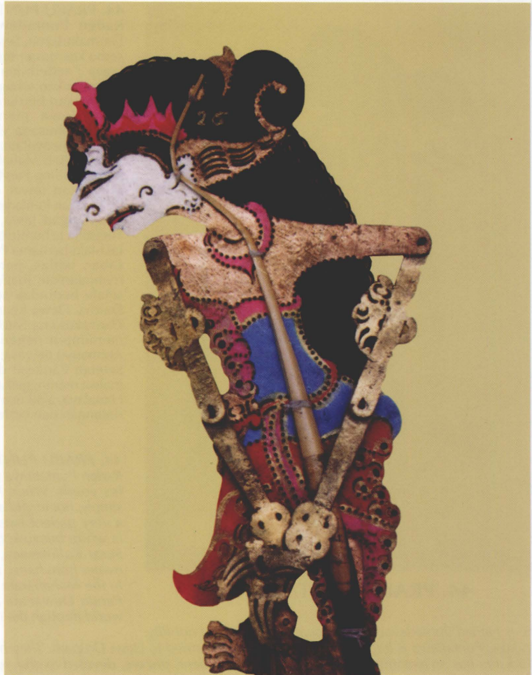
43. DEWI KUNTI