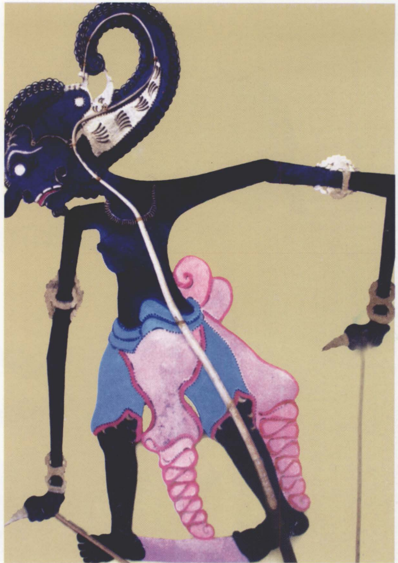
45. BIMA / BRATASENA

Wrekudara highly respects Pandawa's dignity. He is like the parents of the Pandawas, and lives by the following dictum: "die one, die all" and "be happy one, be happy all." After the Baratayudha, he died and reached a redemption (moksa) on his way to Suwargaloka (heaven) with his brothers.