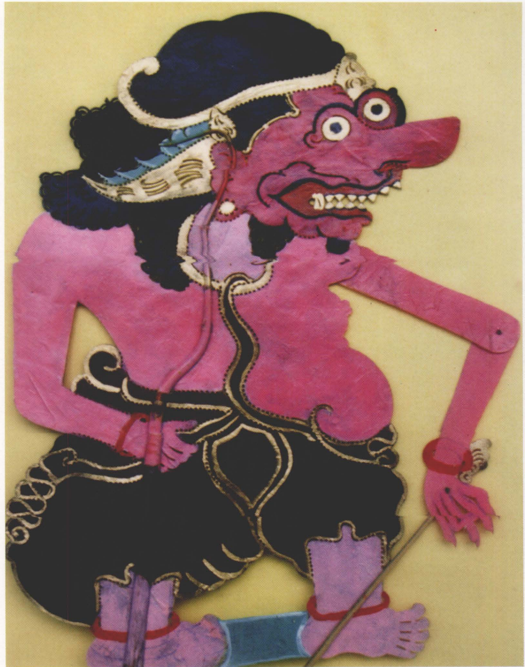
35. KEDAGIT HABANG

Kedakit habang has devilish eyes, a nose that shaped like the bow of a boat, a gaping mouth that shows his teeth and incisors, and disheveled (gimbal) hair.