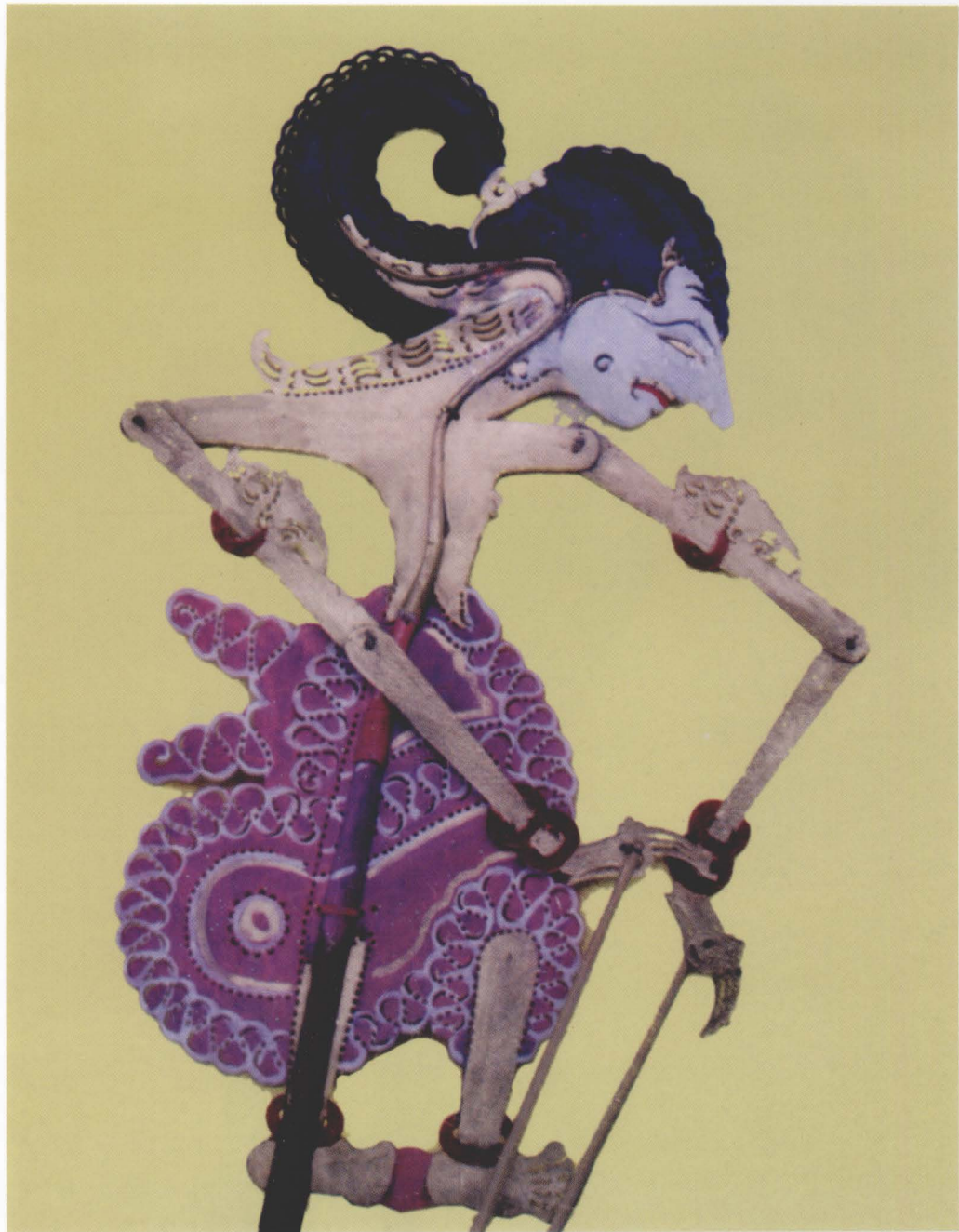
48. R. SADEWA

In Mahabarata script, Sadewa is known as Sahadewa. He is an incarnation of Batara Aswin, god of traditional healer. He was brought up with Nakula by Dewi Kunthi since he was born. Sadewa is a master in mystical knowledge. Therefore, when he was about to marry, he was able to explain about true man and true woman (in Javanese = sejatining lanang, sejatining wadon), as his requirement in searching for a wife. Sadewa is married to Dewi Srenggini, daughter of Prabu Badawangan Nala from the kayangan of Gisiksamudra. They have a son named Widapaksa or Sidapaksa. He possesses Aji Pranawajati, which makes him remembers all past circumstances.