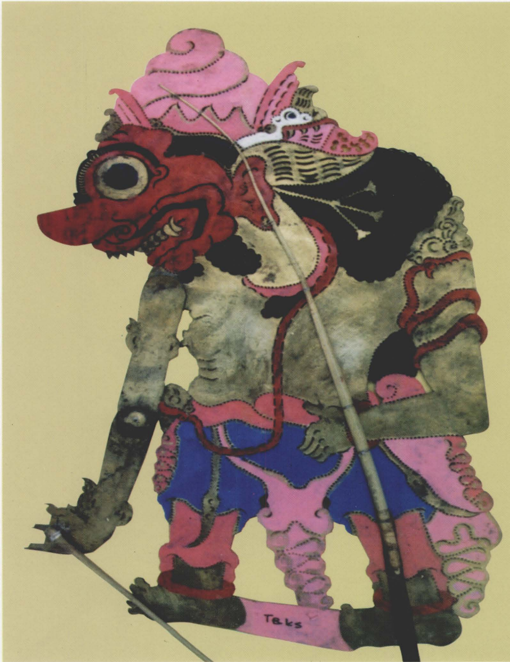
8. BATARA KALA/GUNDAWIJAYA

8. BATARA KALA/GUNDAWIJAYA Batara Kala dilahirkan dari api yang berkobar dan sulit dipadamkan. Pada waktu itu segenap dewa berupaya dengan segala kesaktiannya namun tidak ada yang berhasil memadamkannya, kemudian api berubah menjadi raksasa yang tak terhingga besarnya dan naiklah ia ke kayangan (Kerajaan Dewa) untuk menanyakan bapaknya. Oleh karena Batara Guru sangat khawatir kalau ia mengamuk dan menimbulkan bencana lebih besar, maka kemudian ia diakui sebagai anak Batara Guru. Setelah diakui sebagai anaknya, maka dicabutlah kedua taring (siung) dan kemudian dicipta menjadi senjata, yang kemudian diberikan kepada Arjuna dan Karna. Raksasa tersebut oleh Batara Guru kemudian diberi nama Batara Kala, yang berarti Dewa Waktu dan ia dititahkan bertempat tinggal di Nusakambangan.