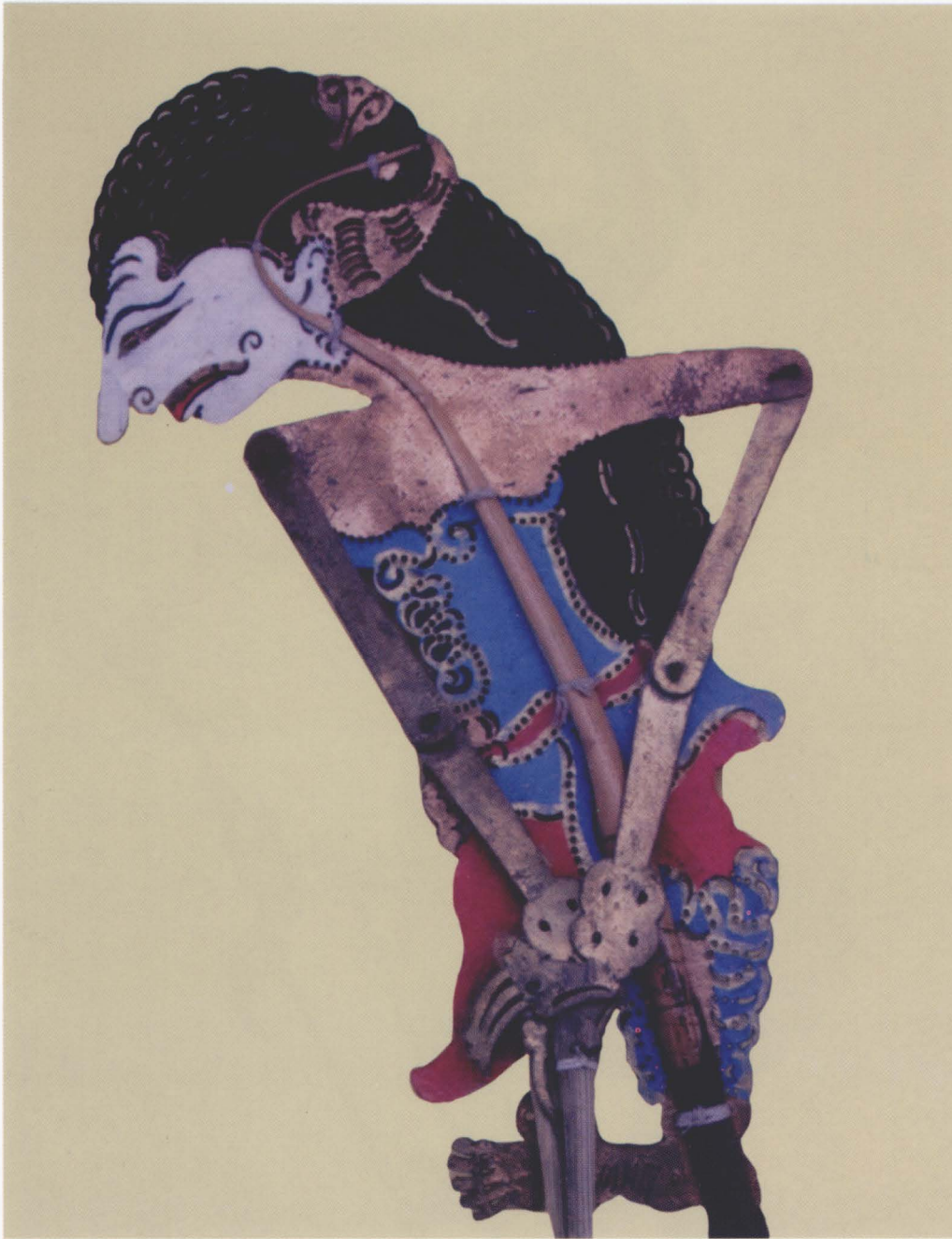
49. DEWI SEMBADRA