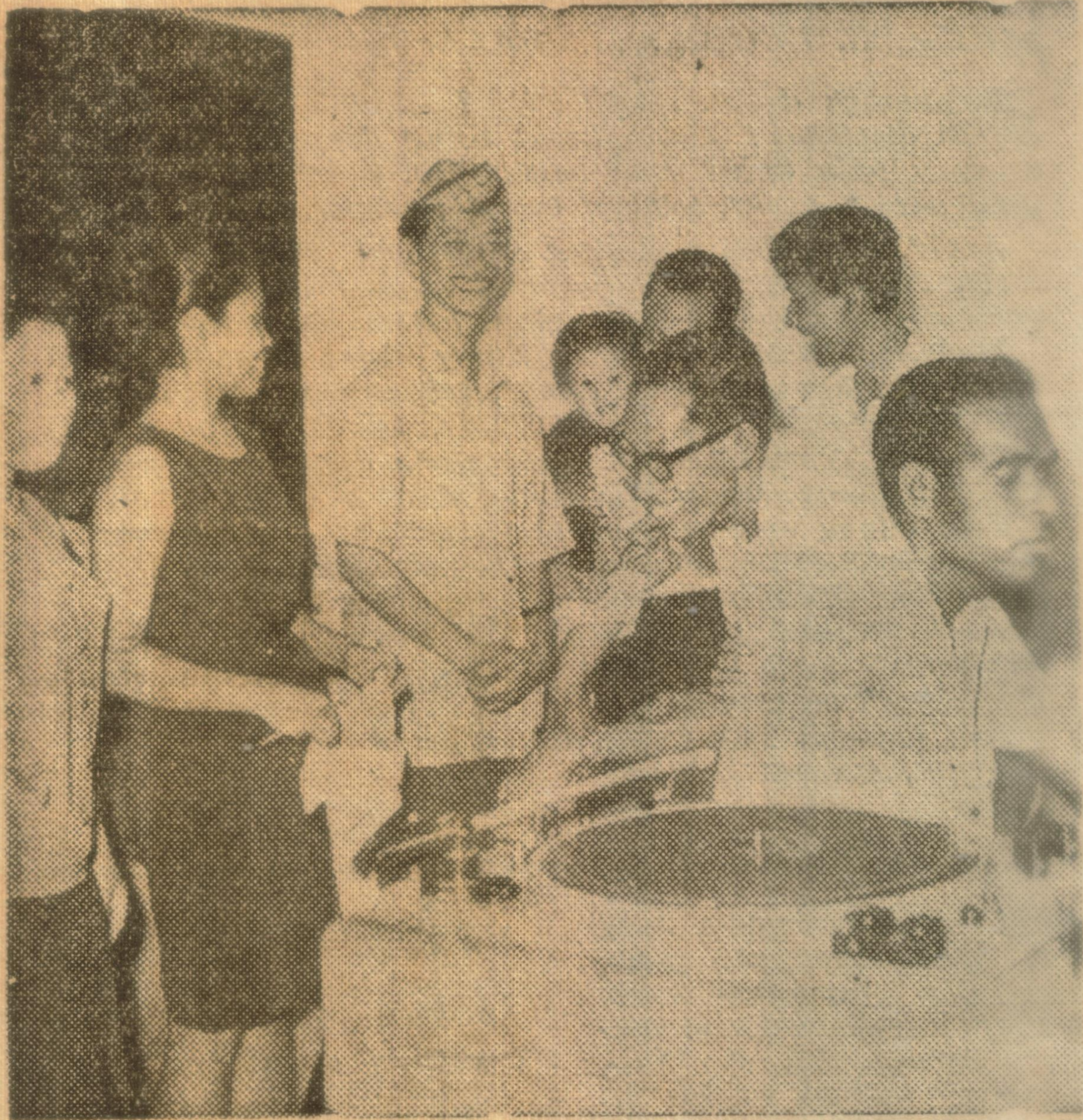
Pak Kasur menonton, tetapi malahan menjadi tontonan.